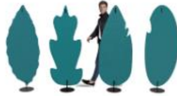
FELT , PARTITION