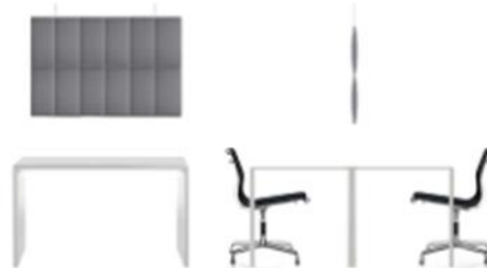
ECORANGE , DESK