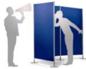
TAILOR MADE , PARTITION