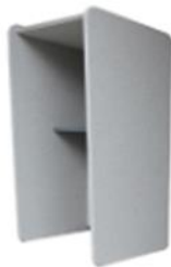
TAILOR MADE , ACOUSTIC FURNITURE