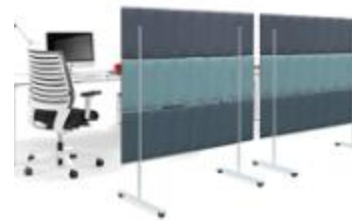
ECORANGE , PARTITION