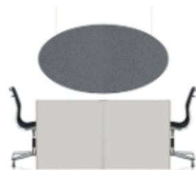
TAILOR MADE , DESK