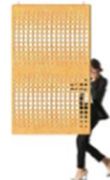
ECORANGE , BAFFLE , PARTITION