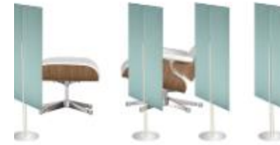
ECORANGE , PARTITION