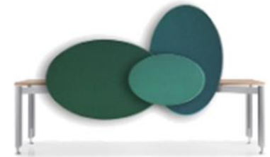
TAILOR MADE , DESK