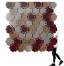
FELT , BAFFLE , PARTITION