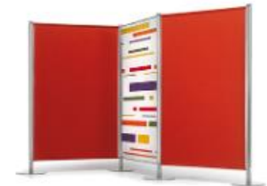
TAILOR MADE , PARTITION