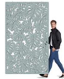
ECORANGE, BAFFLE, PARTITION