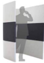
TAILOR MADE , ACOUSTIC FURNITURE