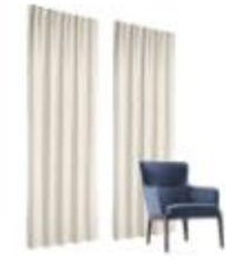
FELT , BAFFLE , PARTITION , CURTAIN