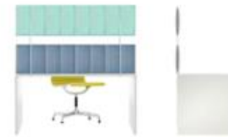
ECORANGE , DESK